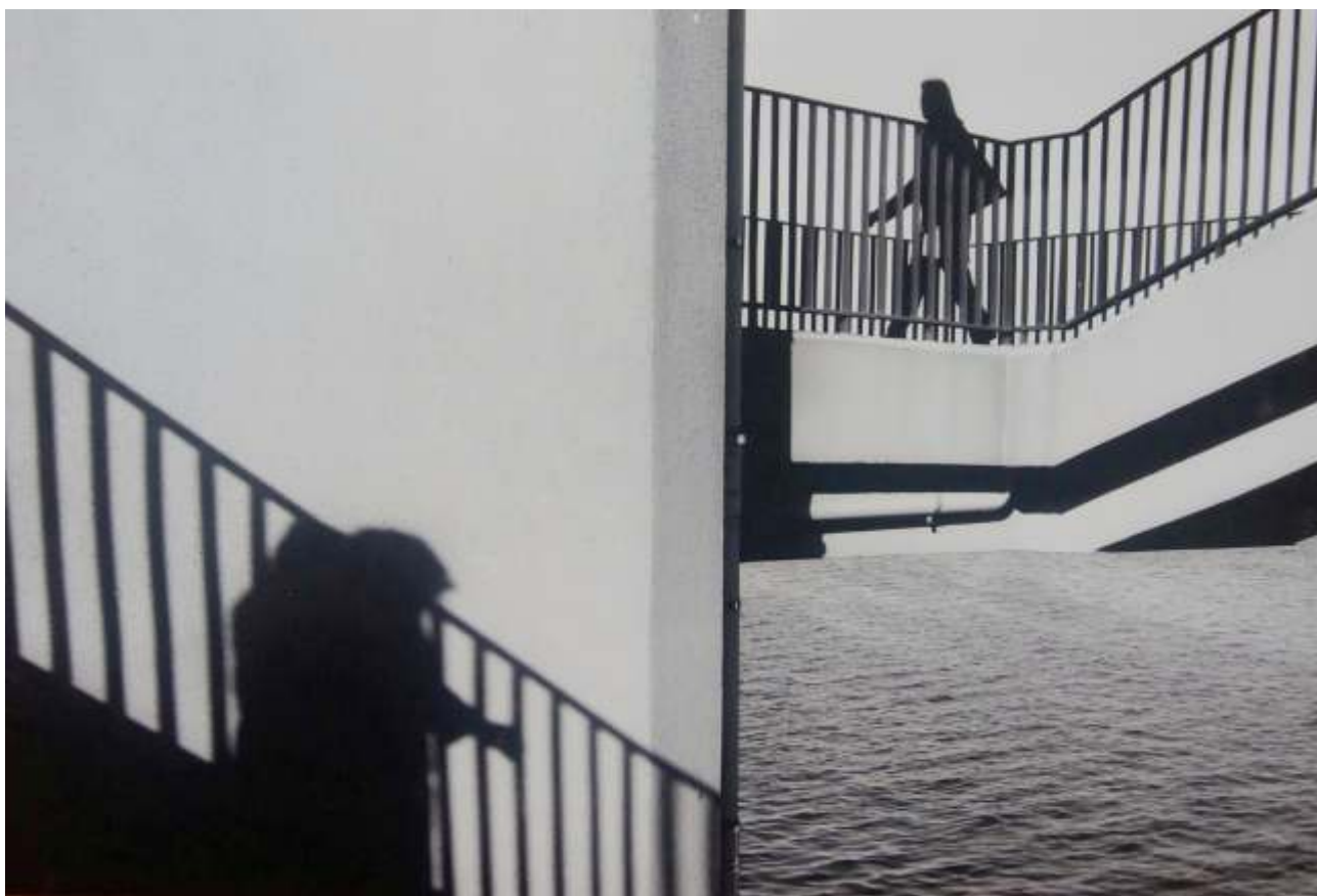
Wyróżnienie Dominika Matej „Inny wymiar 1”