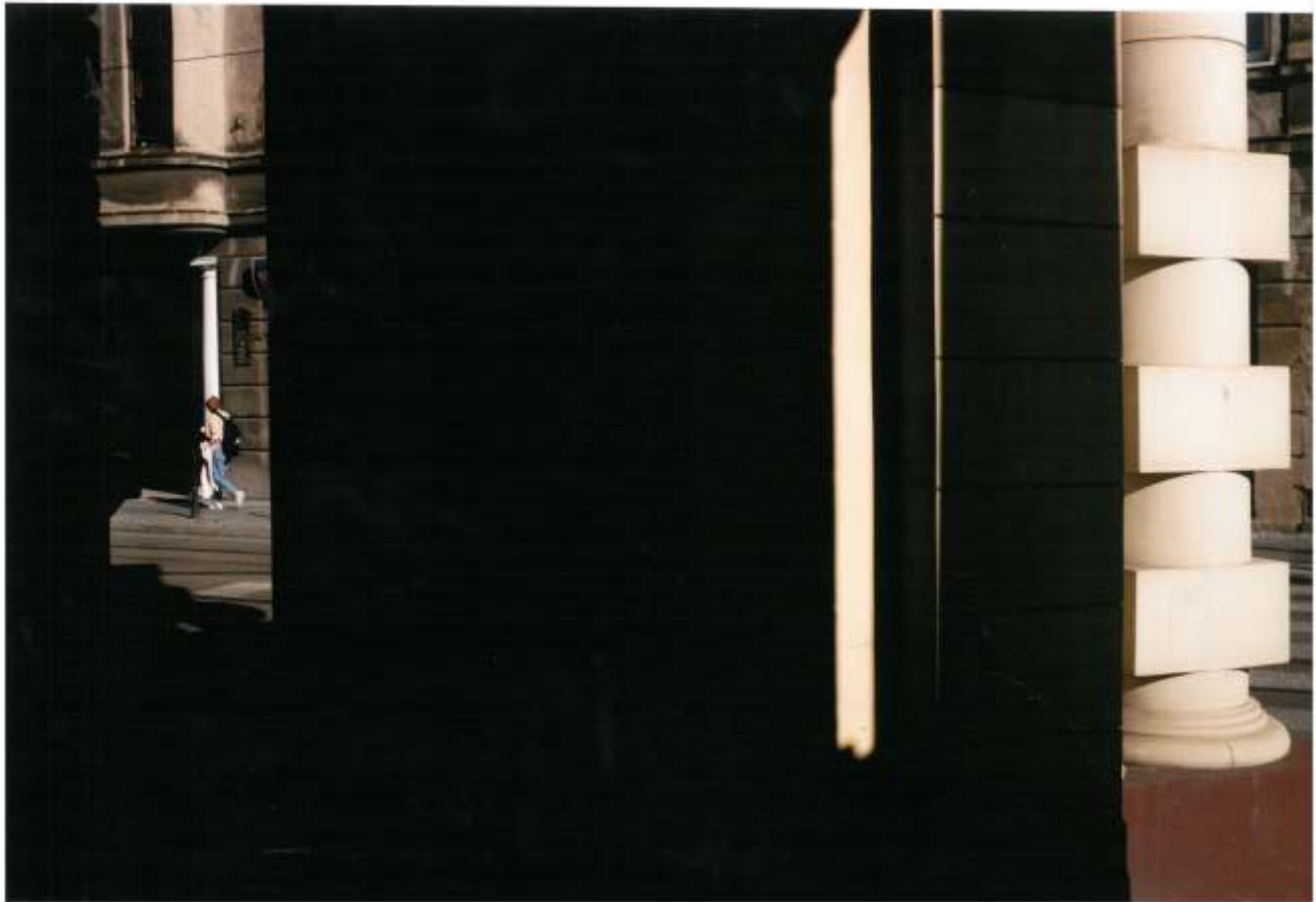
Nominacja Jakub Sosnowski „Linie łamane”