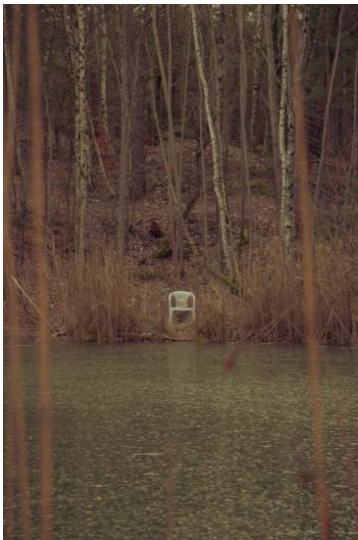
III Nagroda Michał Przybyła z Żar „Tryptyk emocje I”